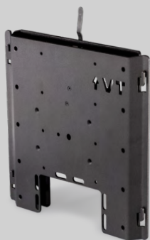
Slim Mount BASE